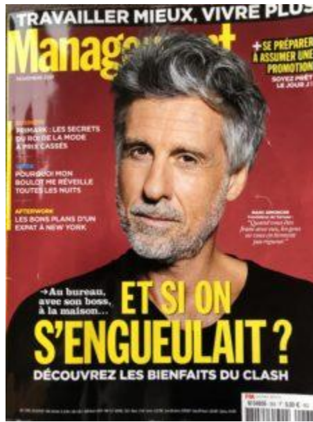
La une du numéro de Novembre 2018

Management Magazine de Novembre 2018 a consacré un dossier aux bienfaits de la libération de la parole.