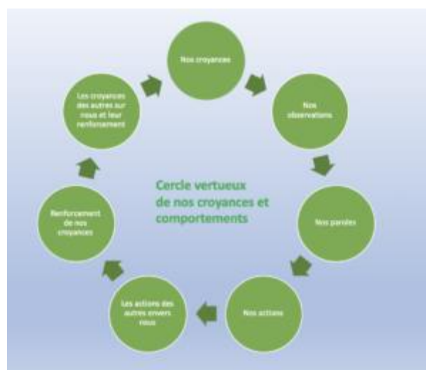
Quand la confiance est là